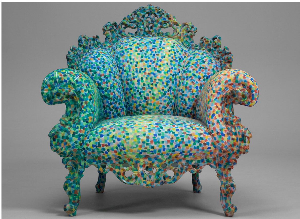
Poltrona di Proust, 1978