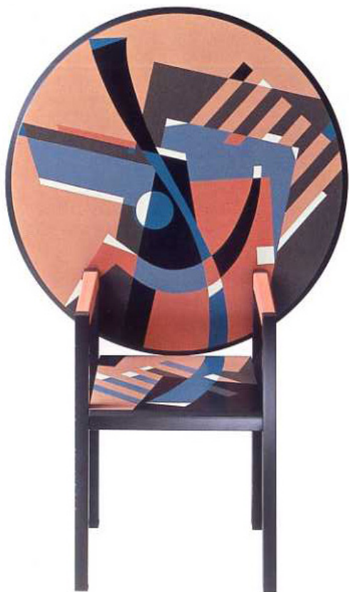
Sans titre, Galerie Dufferge, 2011 / Alessandro Mendini