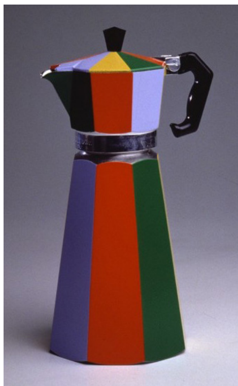
Oggetto Banale , cafetière, sculpture, 1980 © Antonio Colombo Arte Contemporanea

à ses repères culturels dans la recherche des éléments qui sont à l'origine de la survie a été valable à l'époque, et elle l'est encore aujourd'hui. Entre ces deux moments historiques, nous avons eu une période où le projet a été fortement intellectualisé, nous éloignant ainsi de thématiques fondamentales telles que la vie, la mort, la douleur, la spiritualité. Je crois que dans ces dernières années ces éléments émergent et s'imposent dans toute leur exigence, mais ils n'ont pas encore trouvé les formes d'expression souhaitables et les groupes qui les soutiennent.